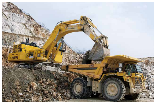
大型重機による積込・運搬作業(大平地区)