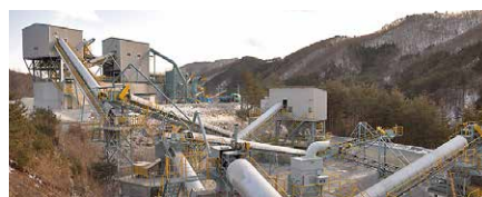
中山骨材プラント