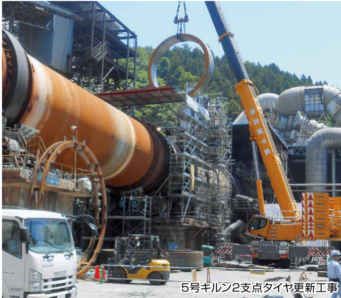
5号キルン2支点タイヤ更新工事