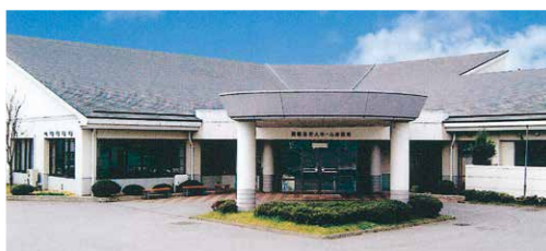
養護(盲)老人ホーム 祥風苑

【法人からのメッセージ】創業者の理念でもある「すべては愛から始まる」をモットーに、高齢者の皆様が自分らしく生活できる施設づくりを目指しています。40年以上の歴史と、常に新しいケアを追求することを目指し、高齢者の皆様の幸せのため、「とことんとことん相手の身になって」を合言葉に役職員一丸となり取り組んでおります。平成30年にはデザイン、建築、実績で評価を頂き、成仁ハウス百年の里が医療福祉建築賞2017を受賞致しました。時代が変わっても、私たちが目指す介護に変わりはありません。私たちと一緒に働いてみませんか! 元気で明るいスタッフを募集しております。