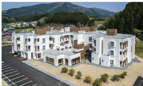
特別養護老人ホーム 成仁ハウス百年の里

■その他 平成26年度4月に、准看護師養成事業を制定し、准看護師を輩出。現在4名の介護職員が准看護師として勤務しております。施設内の研修の他、全国へ人材育成のために研修へ派遣しております。看護師の資格以外にも、介護支援専門員や介護福祉士等多くの有資格者が誕生しております。