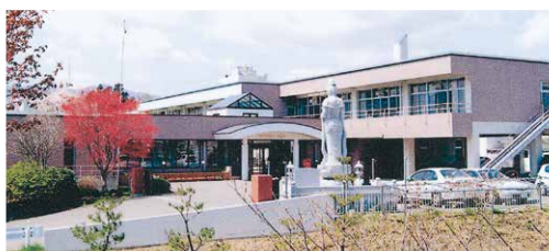
特別養護老人ホーム 富美岡荘