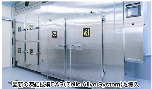
最新の凍結技術CAS(Cells Alive System)を導入

おもしろがり屋で、目標を達成するためにあきらめない方。 人を笑顔にするために、一生懸命になれる方。