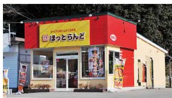
ほっとらんどすわ前店