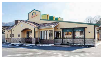
ファミリーレストラン ほっとポット