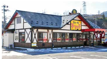
ラーメン屋 一番亭