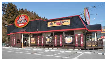
やまなか家大船渡店