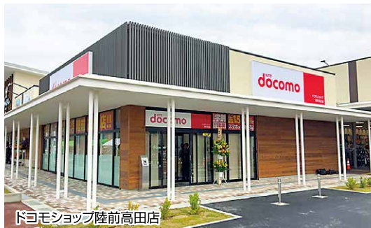
ドコモショップ陸前高田店