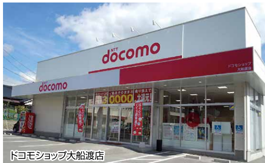
ドコモショップ大船渡店