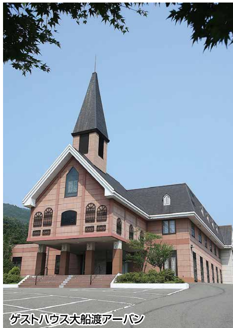
ゲストハウス大船渡アーバン