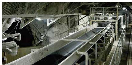
長距離ベルトコンベア(全長4km)