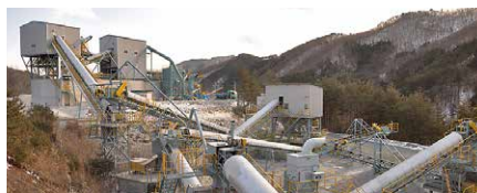
中山骨材プラント