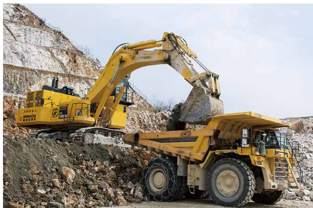
大型重機による積込・運搬作業(大平地区)