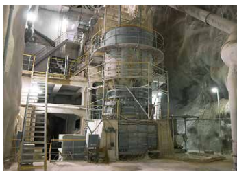
地下にある破碎設備(大平地区)