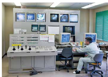
中央操作室による遠隔集中操作