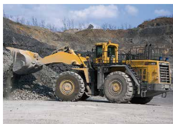
大型重機による掘削・積込作業(坂本沢地区)